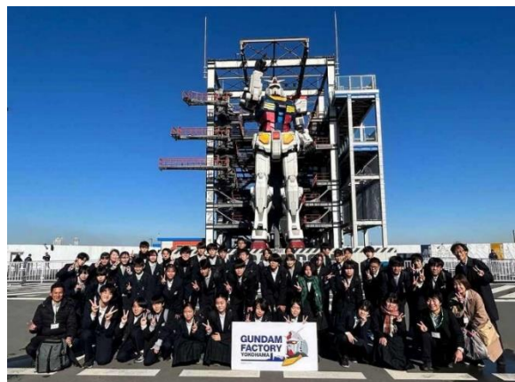
↑2学年 迫力のGUNDAMファクトリーにて集合写真