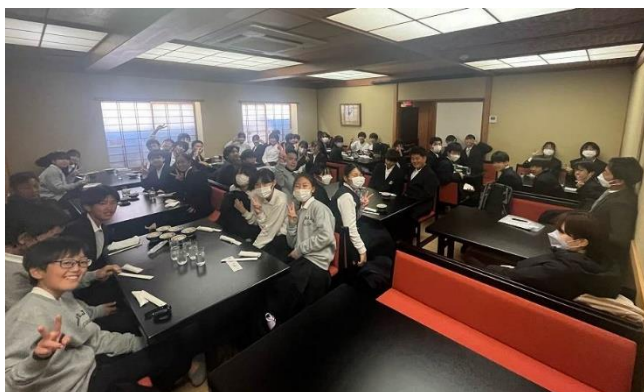
↑1学年 無事に昼食場所に集合し、安心の笑顔で、これから昼食をいただきます

2学年では、横浜に来年3月まで開設されている「GUNDAMファクトリー」が行程に組み込まれ、技術的な講習を受けたり、展望デッキに上がってみたりなどの体験をしました。アニメーションの夢の世界が、技術の進歩により少しずつ実現されていくことを体感することができました。